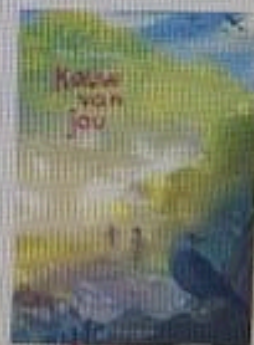
van een Zeeuwse schrijfster