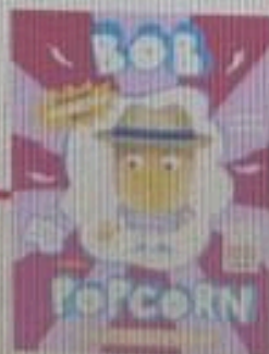
krijgt Bob Popcorn een zusje?